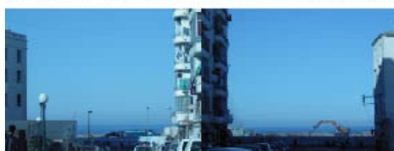
Images D'alger, 2003, tirage offset sur palette