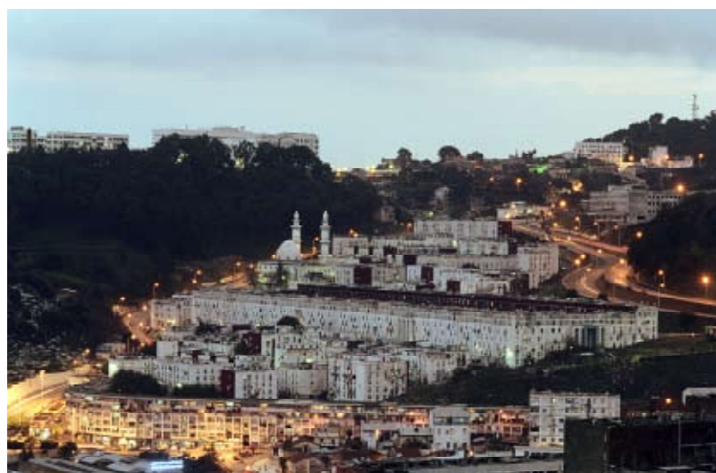
Sans titre, Climat, 2007, tirage argentique