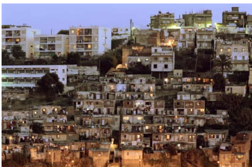
Sans titre, Djenan, 2007, tirage argentique