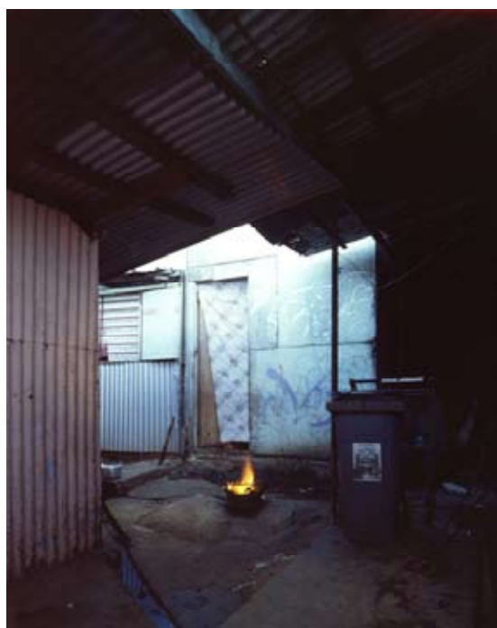
Sans titre, Social housing, Cayenne, 2007 Tirage sur bâche